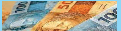
Novo Piso Salarial Estadual/SC

as informações do reajuste do piso salarial estadual nas redes sociais do SITESCH. E que fique bem claro que a negociação e reajuste do piso salarial que está acima do salário mínimo nacional, acontecem por conta da negociação entre as entidades sindicais de trabalhadores e patronal, e que o governador e o patrão não dão de bonzinho, tem luta e resistência do seu sindicato laboral.